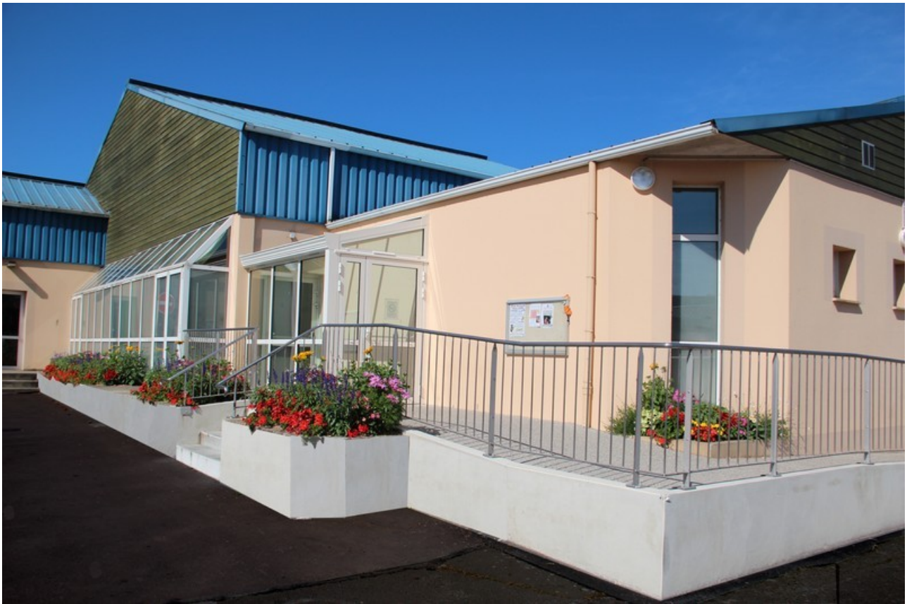
Rue Guillaume le Conquérant Athis de l'Orne 61430 Athis Val de Rouvre